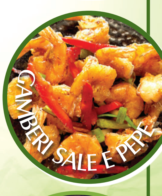
GAMBERI SALE E PEPE