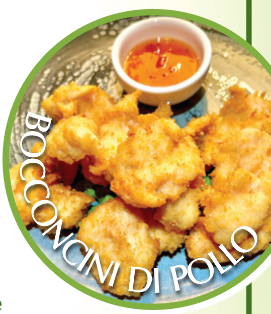
BOCCONCINI DI POLLO