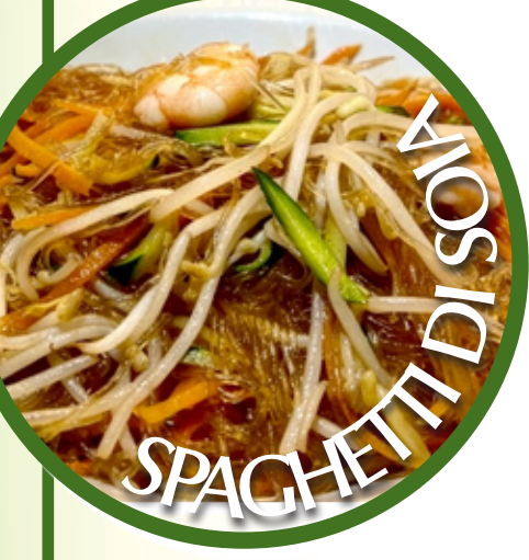
SPAGHETTI DI SOIA