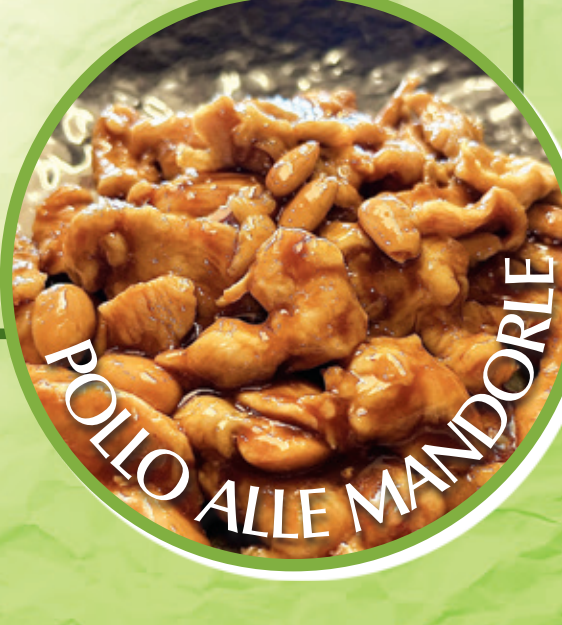
POLLO ALLE MANDORLE