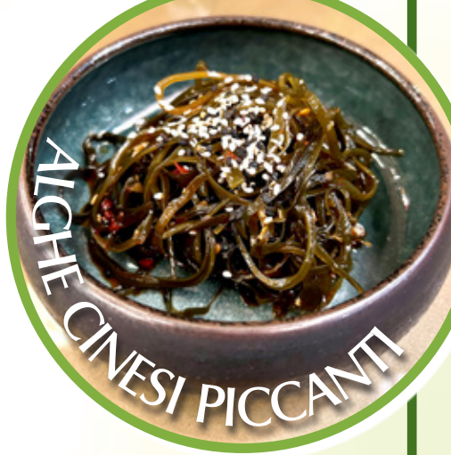
ALGHE CINESI PICCANTI

pepite di pollo fritte servite da salsa spicy maio