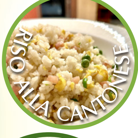
RISO ALLA CANTONESE